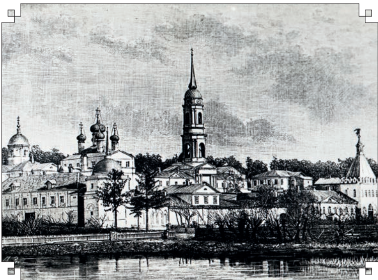
Общий вид Оптиной пустыни. Литография нач. XX века