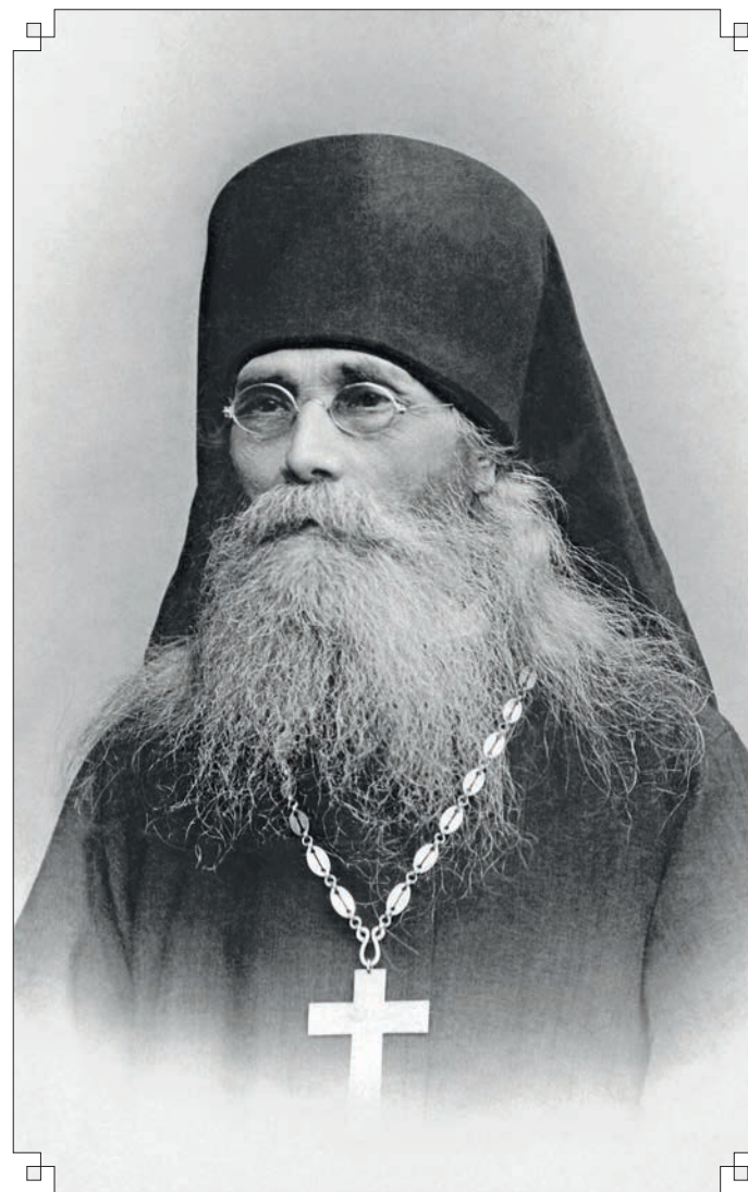
Преподобный старец Варсонофий