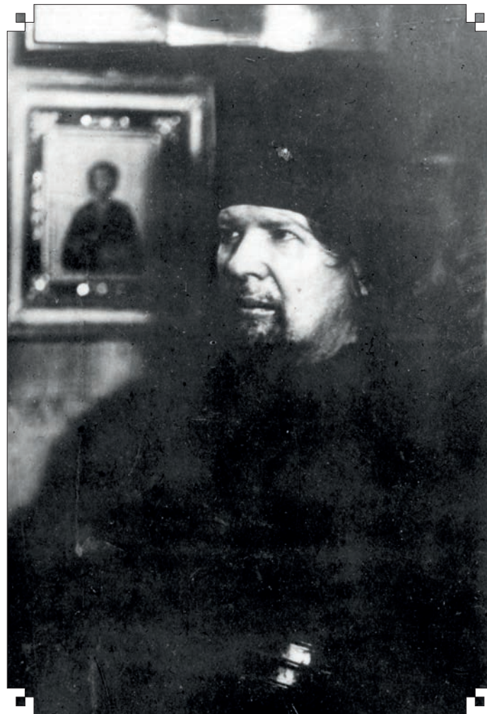
Преподобный старец Нектарий

Когда отзвонили ко всенощной, я с женой отправился в Скит. Дверь в дом старца была заперта.