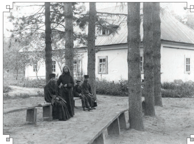
Кедровая роща и братские келлии Скита