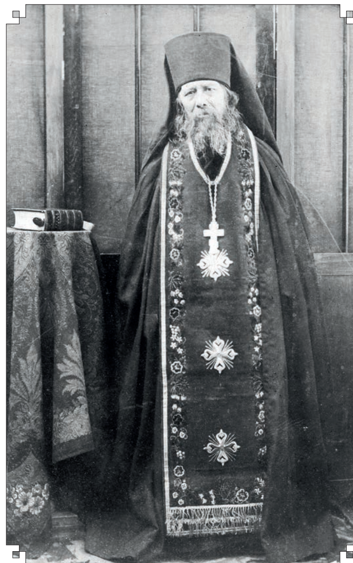
Старец Анатолий (Потапов)

В тот же день я, посетивши отца игумена, попросил у него разрешения пожить мне в Скиту: там больше уединения и духовного отдыха, чем при монастыре 28 . И к вечеру я ушел туда.