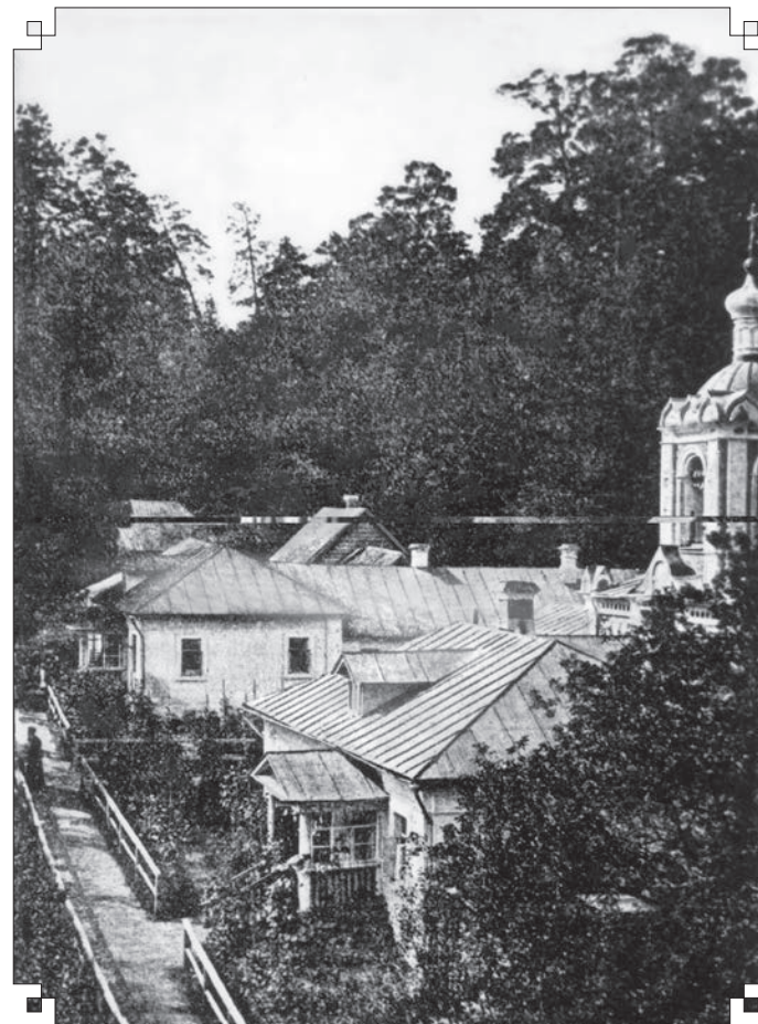
Внутренний вид Предтеченского скита. Келья старцев