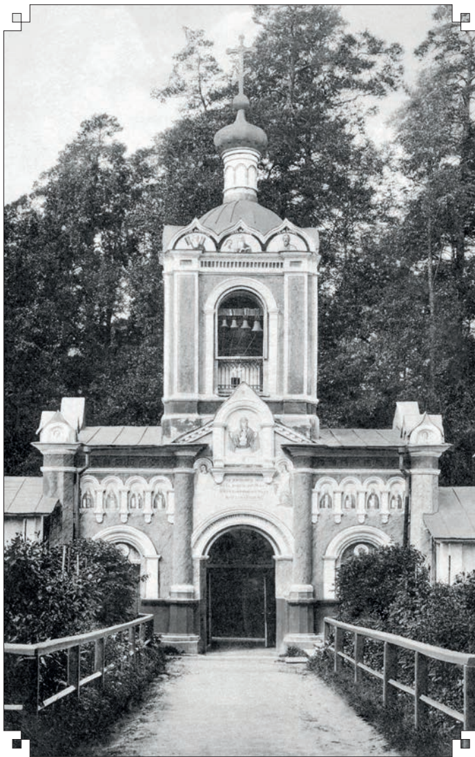
Предтеченский скит. Святые врата

«хозяином», но подчинялся отцу игумену монастыря, как и все прочие. Это был человек высокого роста, уже с проседью и довольно плотный. Познакомились. И я сразу попросил у него благословения сходить исповедаться у старца отца Нектария.