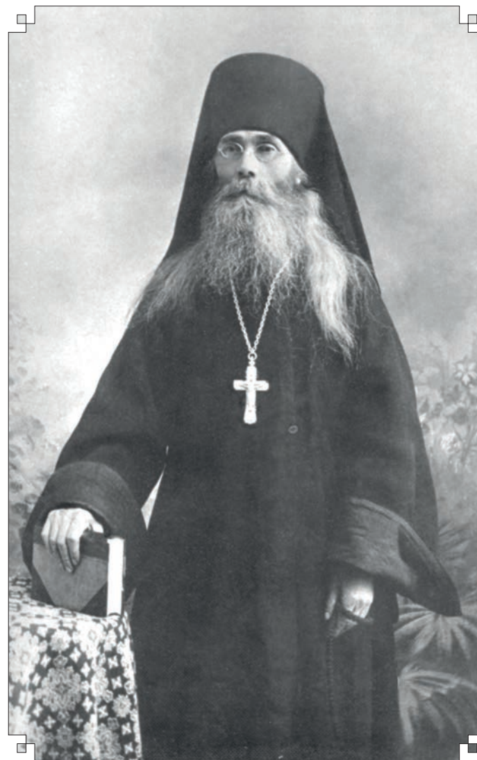
Преподобный старец Варсонофий