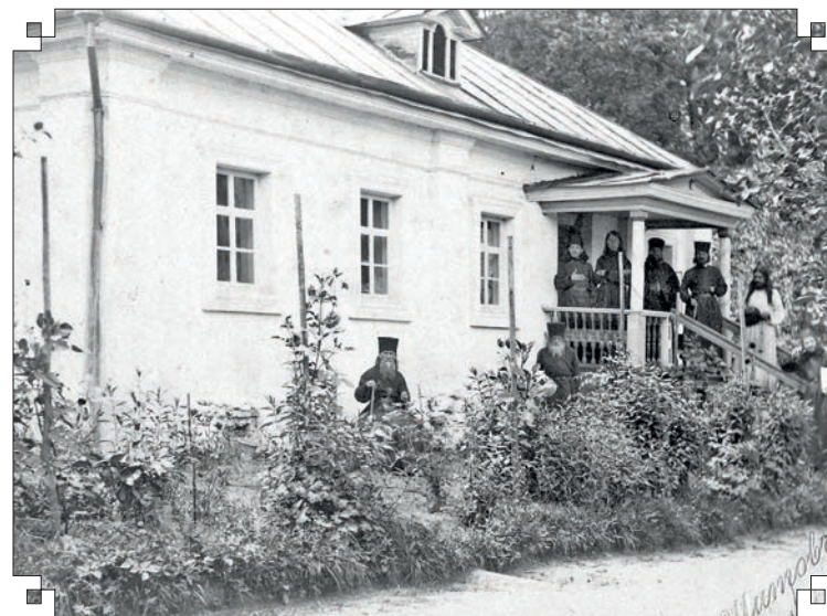
Корпус братских правил

И тут же перекрестился, прочитав молитву Иисусову: «Господи Иисусе Христе, Сыне Божий,