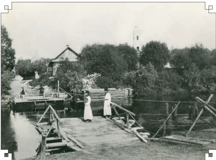
Переезд через реку Жиздру. Фото нач. XX века